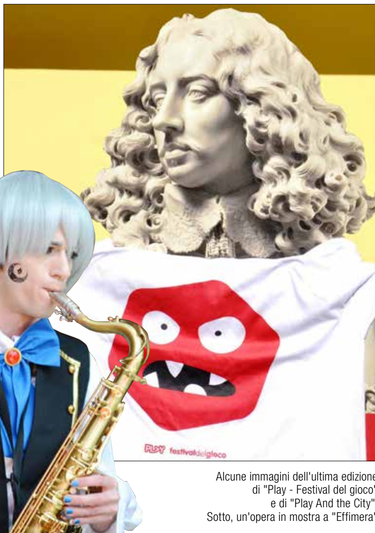
Alcune immagini dell'ultima edizione di "Play - Festival del gioco" e di "Play And the City". Sotto, un'opera in mostra a "Effimera"

Sabato 2 e domenica 3 aprile a ModenaFiere torna il festival "Play", che fa entrare nella più grande ludoteca mai allestita, dedicata a tutti i giochi, tranne quello d'azzardo. E al Mata e in centro con "Play And the City" il festival invade la città