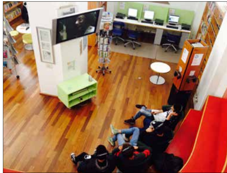
Biblioteca Delfini, alcuni ragazzi durante la visione dei Dvd in zona Holden

Facendo riferimento in particolare ai giovani, ma non solo, si può parlare di una concorrenza tra biblioteche e internet per l'accesso alle informazioni e alla conoscenza? Secondo la responsabile della Delfini, "biblioteca e internet non sono in alternativa, a meno che non si faccia un uso riduttivo di entrambi. A Modena crediamo che il meglio sia internet in biblioteca, facendo tesoro della ricchezza di